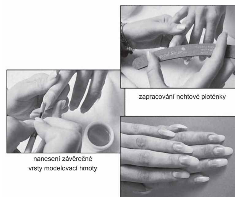
Obr. 18. Modelace nehtů

loketní kloub. Pak ruku obrátíme a provádíme tytéž tahy na spodní straně ruky. Nezapomínáme na promasírování loketního kloubu.