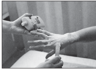
aplikace masážního přípravku