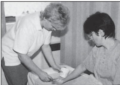
aplikace masážního přípravku