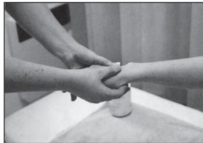
vlastní provedení masáže